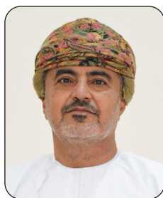
HE Saeed bin Hamoud bin Saeed Al Maawali Minister of Transport, Communication and Information Technology